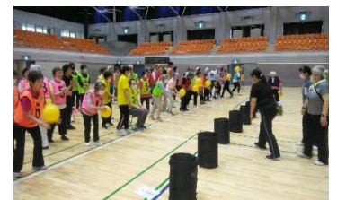
手のひらターゲット