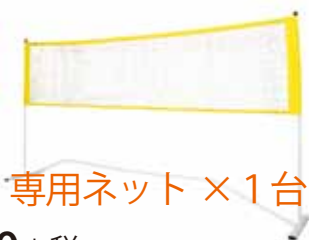
専用ネット × 1台