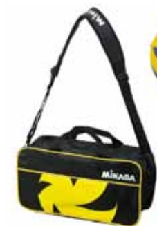
バック × 1個